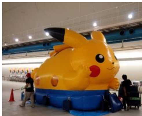
ピカチュウふわふわ