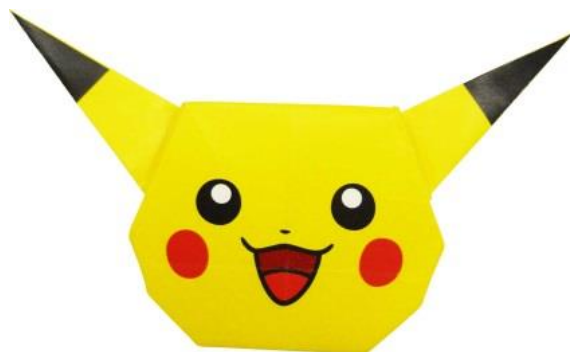
ピカチュウおまもり