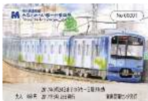
新高島駅～元町・中華街駅各駅事務室で発売中の 一日乗車券