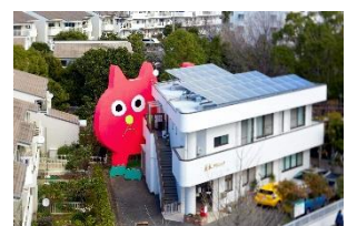
飯川雄大《デコレータークラブ - ピンクの猫の小林さん - 》2020年

昨年度、「猫の小林さんとあそぼう！プロジェクト」を展開し、金沢区並木で巨大な作品《デコレータークラブ - ピンクの猫の小林さん - 》を設置。また、現在は「ヨコハマトリエンナーレ 2020」に参加しています。