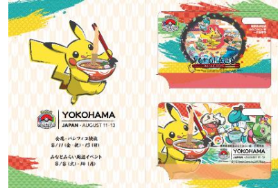
※乗車券を差し込んだイメージ