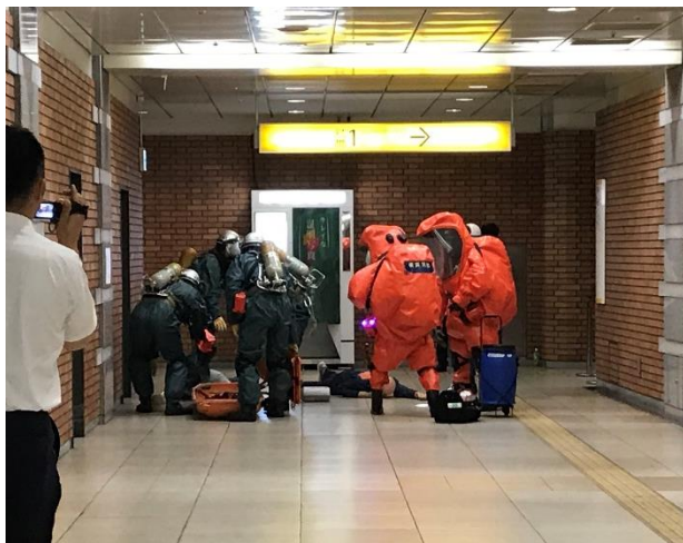
2019年度 於：日本大通り駅構内コンコース