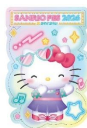
ラッピングデザインの一例