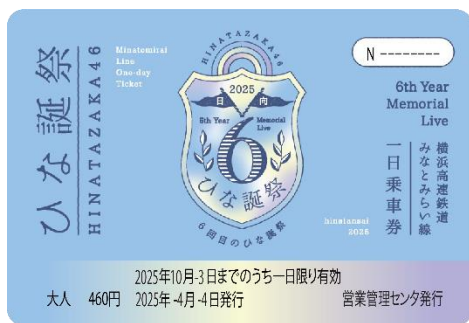
一日乗車券イメージ